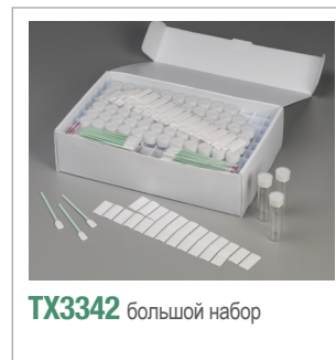
TX3342 большой набор