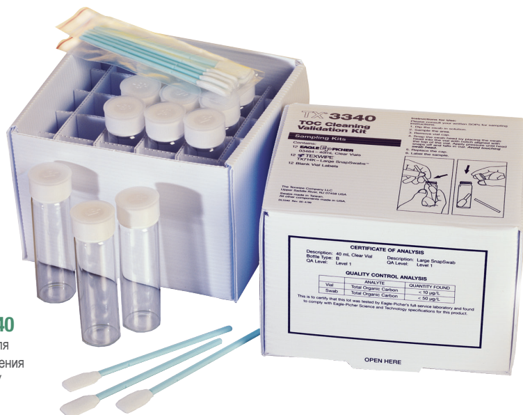
TX3340 Набор для определения COU